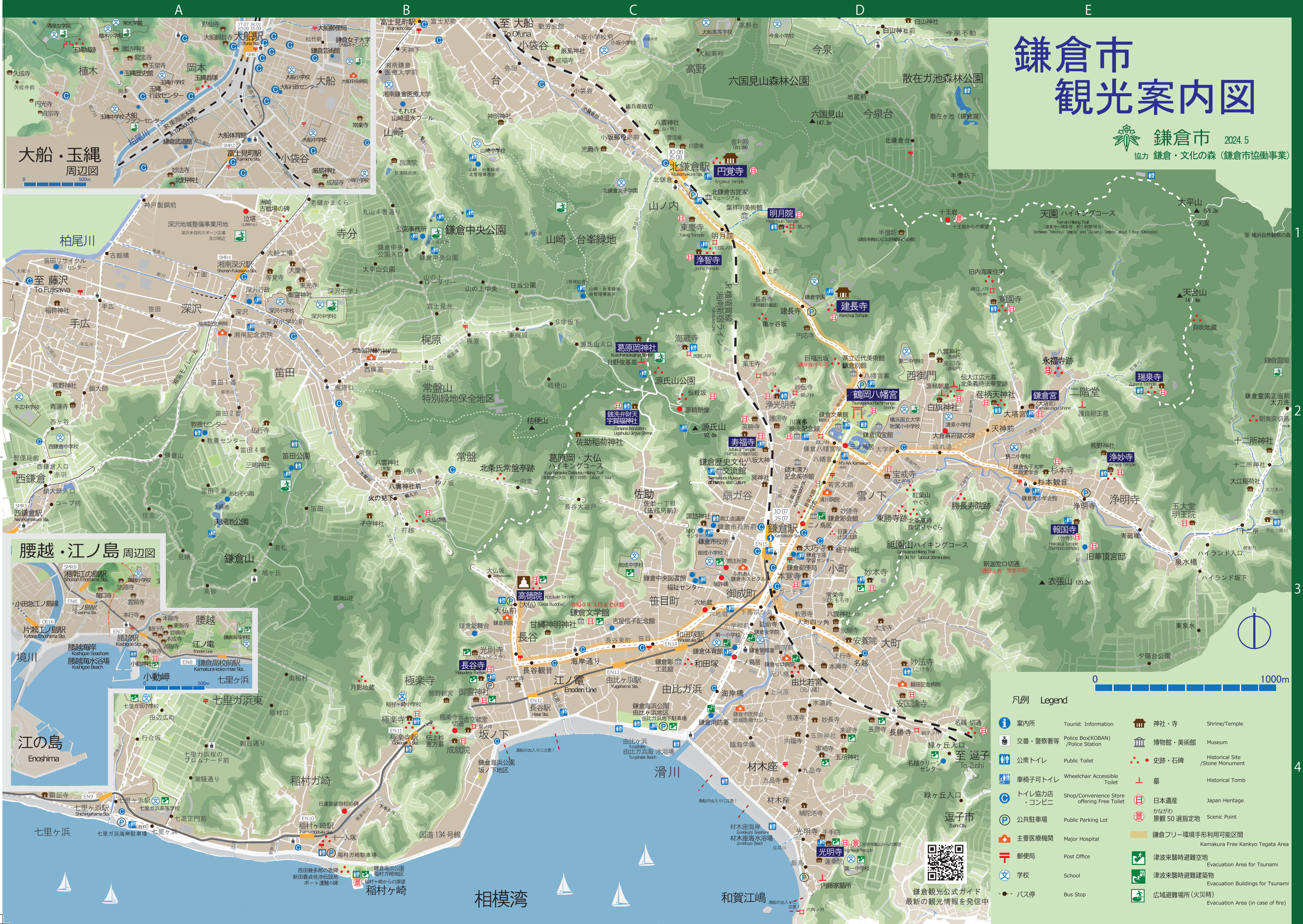
大船・玉縄 周辺図