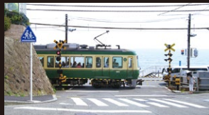
江ノ電鎌倉高校前駅の踏切