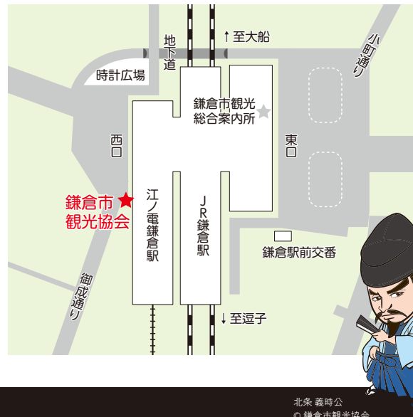
北条 義時公