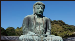
高德院の鎌倉大仏