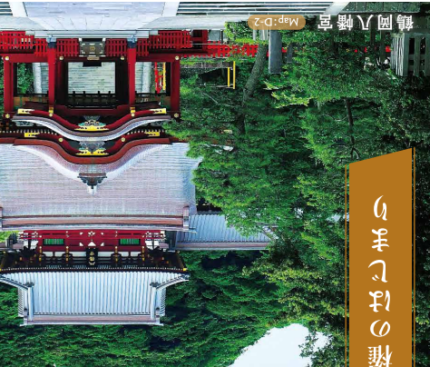
武家政権のはじまり