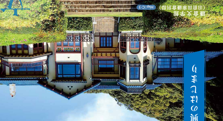
文学復興のはじまり