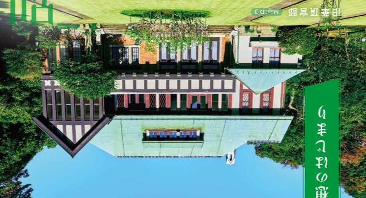
保養思想のはじまり

明治時代、保養地として脚光があたり、名士たちがこぞって別荘を建設。海浜保養地としての鎌倉の地域特性が認められたころ、機須賀線の開通をきっかけに、財界の名士たちがこぞって別荘を建設。今もいくつかの別荘建築が残り、鎌倉独特の景観を作り出しています。