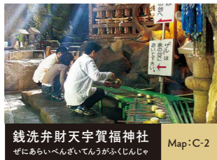
銭洗弁財天宇賀福神社 Map:C-2

足利義兼により創建された禅寺。境内にある茶席「喜泉庵」では、枯山水庭園を眺めながら抹茶とお茶菓子を堪能できます。