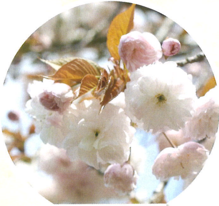
フゲンゾウ(桜) 4月上旬頃