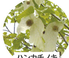
ハンカチノキ 4月中旬頃