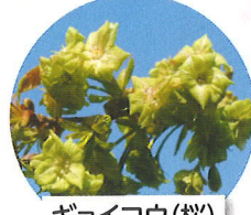
ギョウコウ(桜) 4月上旬頃