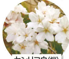
センリコウ(桜) 4月上旬頃