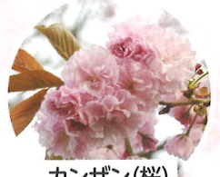
カンザン(桜) 4月上旬頃