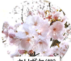
キリガヤ(桜) 4月上旬頃