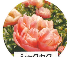
シャクヤク 5月上旬頃