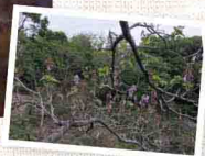
5月は桐がみごろです