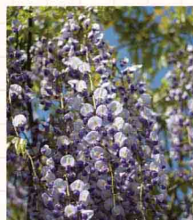
鶴岡八幡宮のフジ