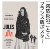
「突然炎のトコ」 フランス版ポスター