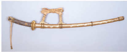
国宝「沃懸地杏葉螺細太刀拵」 鶴岡八幡宮所蔵