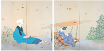
《桜もみぢ》昭和7年(1932)同館蔵