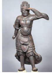
鎌倉国宝館所蔵 卯神像 (十二神将立像のうち)