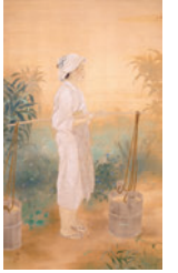
《水汲》大正10年(1921) 同館蔵