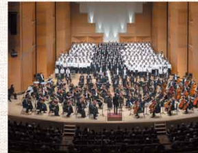
2018年公演ステージより

料全席指定2000円、学生1000円 ※4歳よりご入場いただけます。 ※学生は4歳から24歳以下対象。当日、身分証要提示。 JR大船駅より徒歩10分