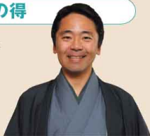
鎌倉市長 松尾 崇

日常の早朝ランニング。凛とした空気の中、音に耳を澄ませ、香りを感じ、見える景色を楽しむ。充実した一日のスタート、鎌倉の朝活は魅力満載です。