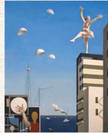
古賀春江(窓外の化粧) 1930年油彩 カンワズ 神奈川県立美術館蔵

料一般600円、20歳未満・学生450円、 65歳以上300円、高校生100円 月曜(13日(月・祝)は開館)、 1日(水・祝)～3日(金) JR鎌倉駅より徒歩15分