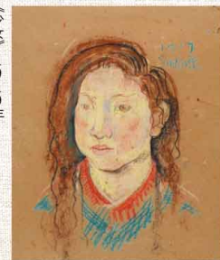
《少女》1919年 パステル 紙 個人蔵

料一般700円、20歳未満・学生550円、65歳以上350円、高校生100円 月曜(24日(月・祝)は開館) JR鎌倉駅より徒歩15分