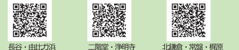
長谷・由比ガ浜 二階堂・浄明寺 北鎌倉・常盤・梶原